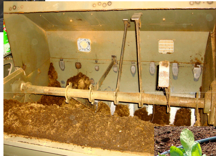
Equipamento UCP (Unidade Compacta de Processamento)